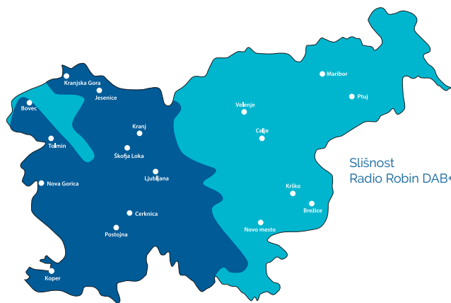
Slišnost Radio Robin DAB+

Vsak dan nas posluša več kot 20.000 prebivalcev goriške statistične regije.